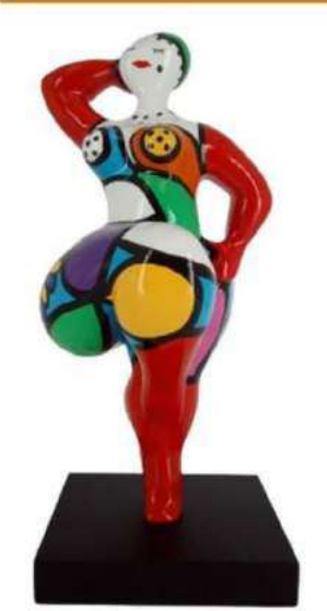
FLEUR DE MARYLIN 11102 XS-S-M-L