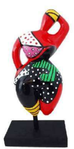
CHARMANTE II 8031 S-M-L