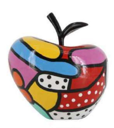
FASHION 19003 S-M