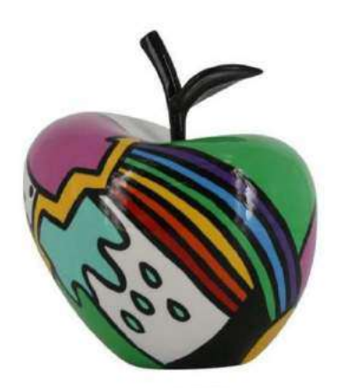
GALAXIE 19004 S-M