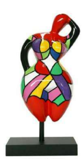
CAPTIVANTE 8030 S-M-L