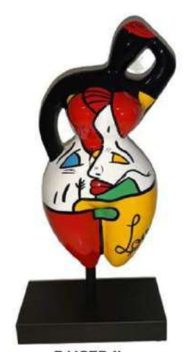
BAISER II 8026 S-M-L