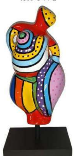
DOUCE SEDUCTION 1057-S-M-L