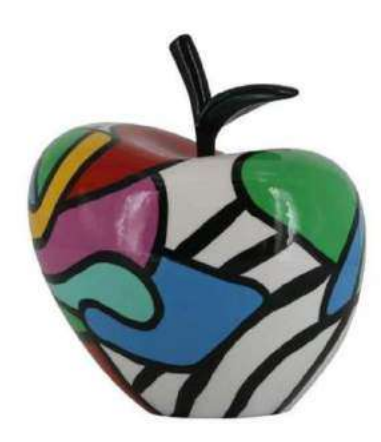
ATTACHANT 19002 S-M