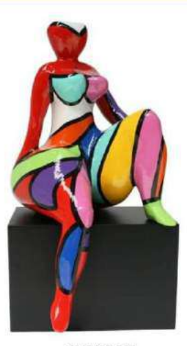
SUPERBE 4031 S-L