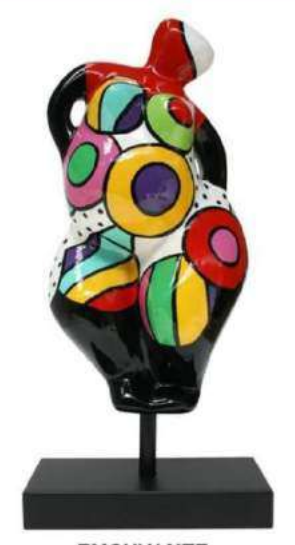
EMOUVANTE 1050 -S-M-L