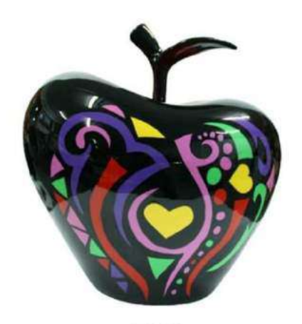
TAT00 19000 S-M