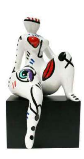
EPOUSTOUFLANTE 4033 S-L