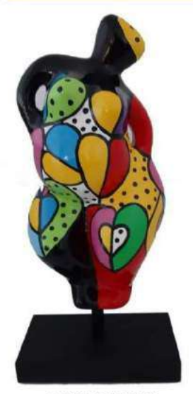
LOVE IN YOU II 1027-S-M-L