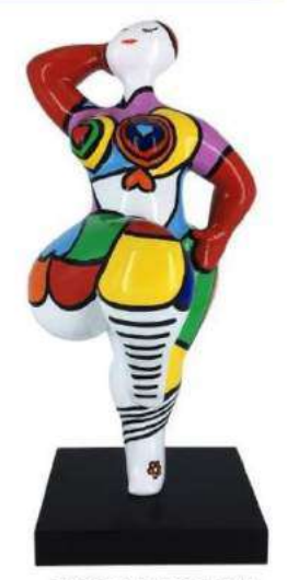
SOUS LE CHARME 11104 XS-S-M-L