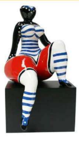
INDEPENDANTE 4032 S-L