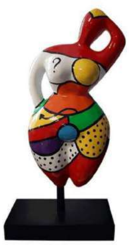
PETITE FOLIE 8033 S-M-L