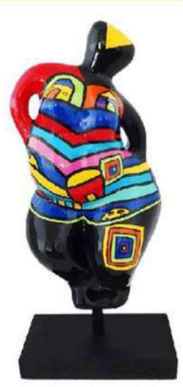
THE ROAD TO YOU 1053-S-M-L