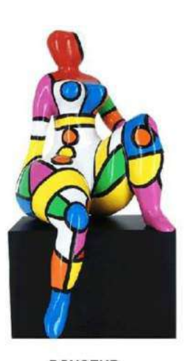
DOUCEUR 4035 S-L