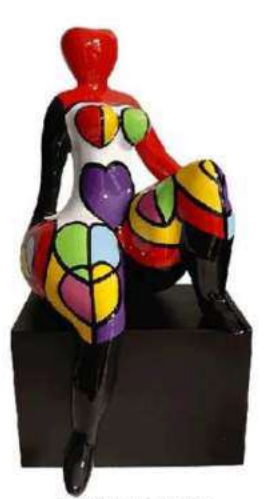
REVE EVEILLE 4034 S-L