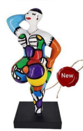
AU COEUR DE MES PENSEES 11106 XS-S-M-L