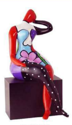
BEAUTIFUL 16005 S-M