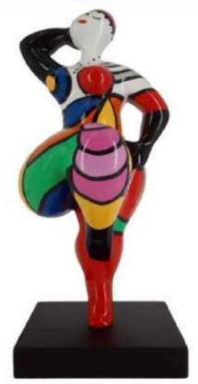
JOIE DE VIVRE 11103 XS-S-M-L