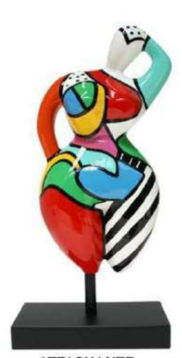
ATTACHANTE 8029 S-M-L