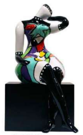
SENSUELLE 16004 S-M