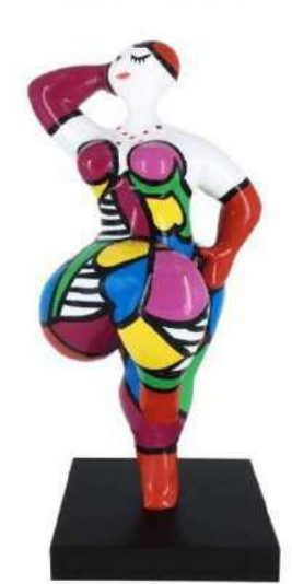
LA VIE EN ROSE 11105 XS-S-M-L