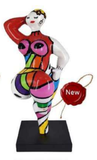
MON ROUDOUDOU 11107 XS-S-M-L