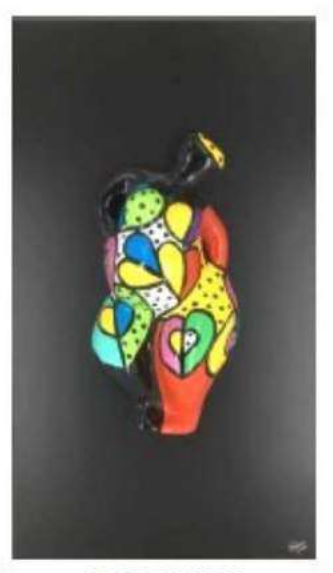
LOVE IN YOU