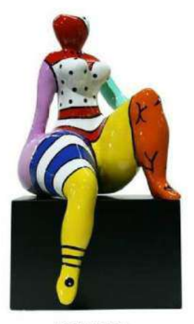
ROMANCE 4029 S-L